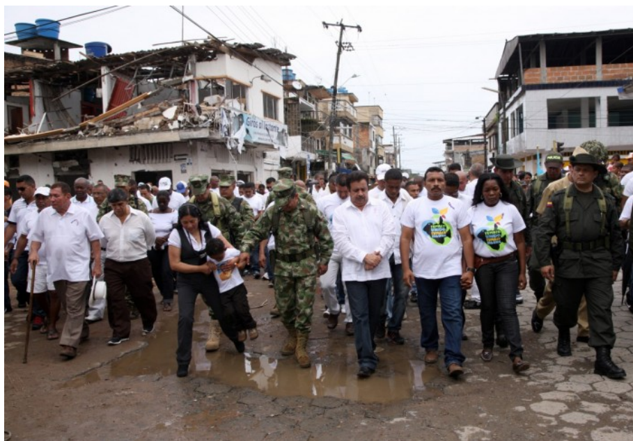
Manifestaciones tras ataque de las FARC en Tumaco, 2012.

Hay mucha distancia entre lo que ocurría entonces y lo que ocurre ahora, ya que su accionar es mucho más localizado, circunscrito a las periferias o zonas de repliegue, en municipios estratégicos por el narcotráfico como el caso de Tumaco en Nariño y municipios de departamentos como Arauca, Putumayo o el Catatumbo, en las fronteras.