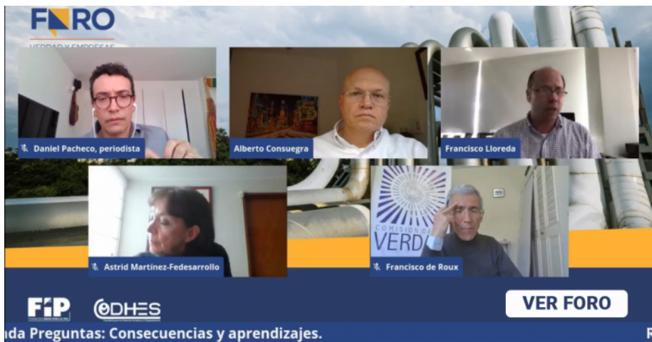
Líderes del sector petrolero, expertos y Francisco de Roux, Presidente de la Comisión de la Verdad, durante el foro virtual, moderado por el periodista