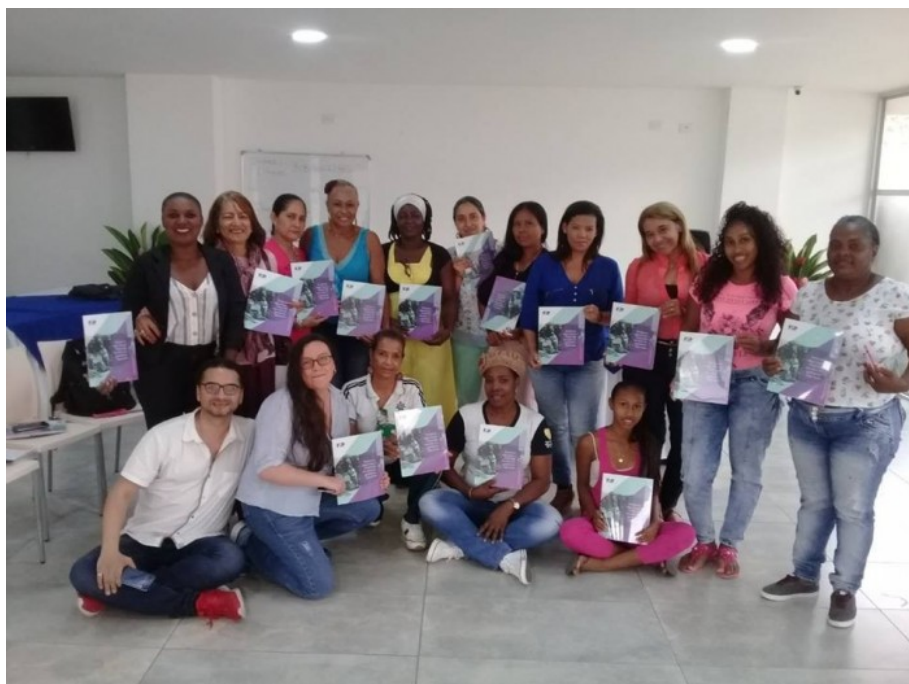
Representantes de organizaciones de mujeres en la socialización del informe FIP en Apartadó

Sobre las vivencias de las mujeres y sus percepciones de seguridad y violencias contra ellas, el informe destaca: